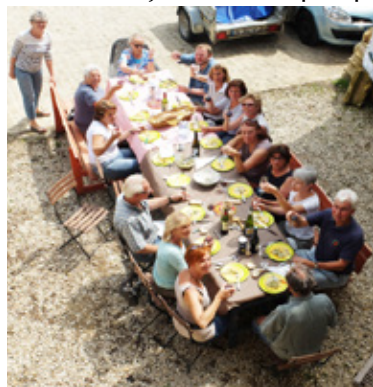
Claudine de Theux de Monjardin